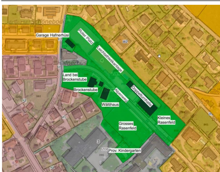
Abbildung 1: Bearbeitungsperimeter des Gesamtleistungswettbewerbs