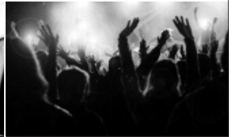
Kultur und Freizeit