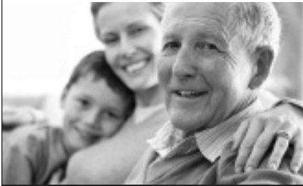
Wohnen im Alter