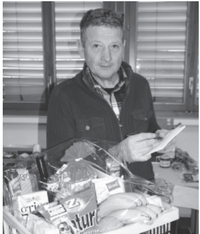
Das Hornusser-Lotto vom 4. und 6. März 2016 lockte auch dieses Jahr viele Lottofreunde nach Schlosswil.

Bei der Gelegenheit möchte ich alle recht herzlich einladen an unserem diesjährigen «Plauschhornussen» teilzunehmen. Besuchen Sie uns am Samstag, 4. Juni auf dem Thalibühl, wenn wir in den Kategorien Frauen, Kinder und Nichthornusser ein Hornussen für jedermann/frau von Jung bis Alt durchführen. Dies ist eine ideale Gelegenheit für alle jene, die sich noch nie eingehend mit dem Sport Hornussen befasst haben. Probieren geht bekanntlich über Studieren! Gerne erklären wir allen Interessierten unser Traditionsspiel und bedienen Sie zugleich mit Speis und Trank.