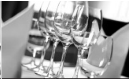
Hotel und Restaurant